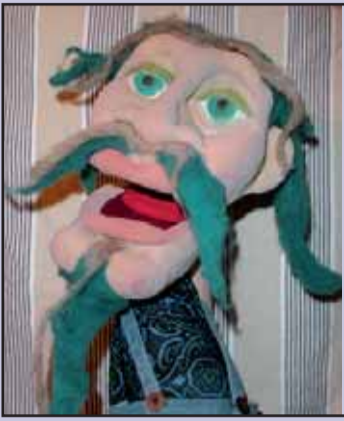
Nukketeatteri Katputli esittää Karhu poikana -näytelmää lokakuussa.