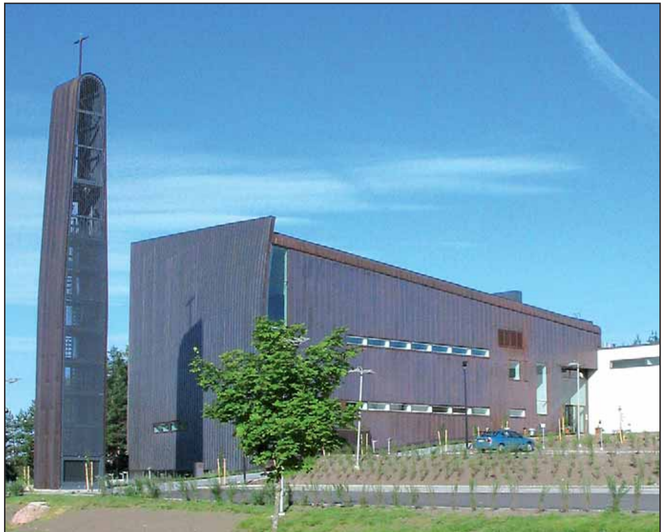
Klaukkalan kirkko saa ulkopuolelleen juhlavalaistuksen tulevana adventtina.