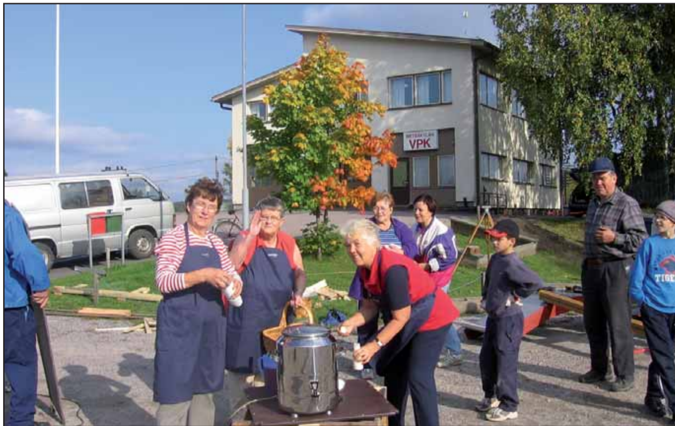
Emo ry, eli Etelä-Suomen maaseudun osaajat, tukee maaseudun elävöittämistä. Kuva Metsäkylän VPK:n leikkikentän rakentamisesta.

Elinkeinojen kehittämishankkeilla parannetaan muun muassa elinkeinotoiminnan yleisiä edellytyksiä, maaseudun palveluiden suunnittelua, kehittämistä ja