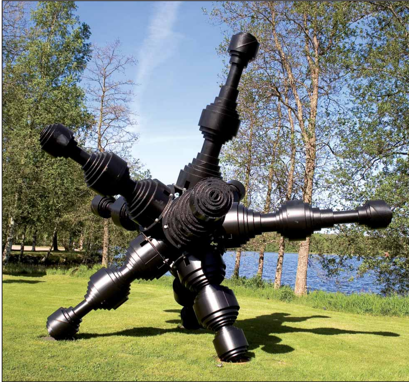
Kimmo Schroderuksen Mörkö-teos on tällä hetkellä esillä Oslossa Kontra -näyttelyssä.